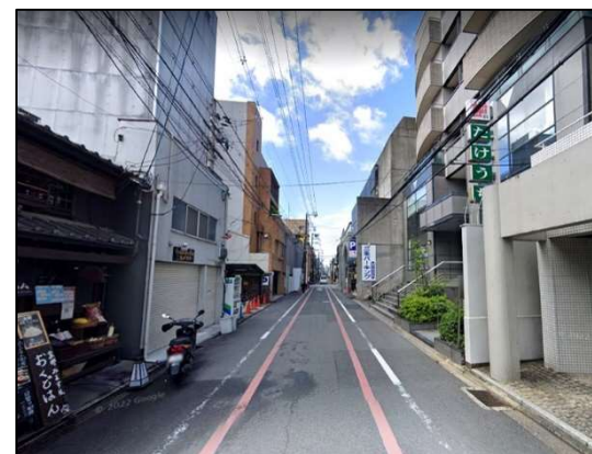
京都市役所近く、御幸町通に面す戸建て店舗