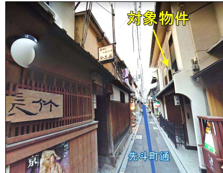
※先斗町通に面す京町家