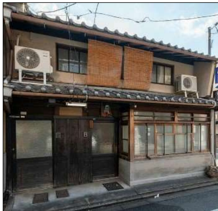
未改修の京町家 2階建 31.71坪 ※飲食可(重飲食不可)但し、大規模な改修工事要す