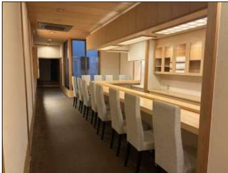
※鮎店の居抜き(一部、什器の残置有り)