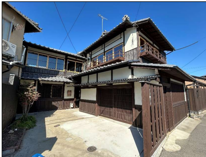
3棟一括の京町家 28.47坪